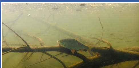
Rotauge mit Jungfischen

Ein 39 m 2 großer Raum ermöglicht dem Besucher neue Ausblicke in die Unterwasserwelt. Ausgestattet mit großen Scheiben zum Fischwanderweg, aber auch mit direktem Blick in die Lahn kann man hier die Fische in ihrer natürlichen Umgebung beobachten. Ein weiteres Fenster lässt die Besucher Einblicke in